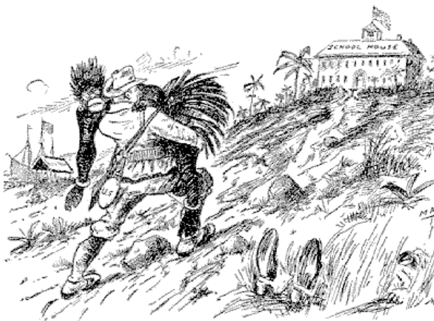
THE WHITE MAN'S BURDEN.— The Journal, Detroit.